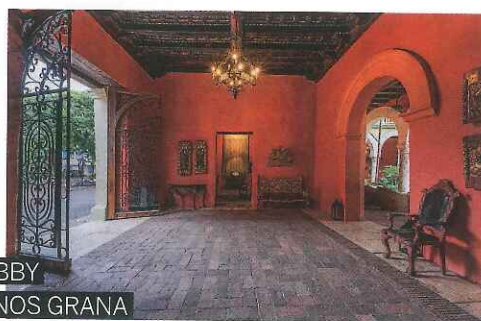
UN LOBBY EN TONOS GRANA

Desde el lobby pasando por su claustro, sus suites coloniales, sus corredores o su antigua capilla, el Santa Clara ofrece una estancia inolvidable.