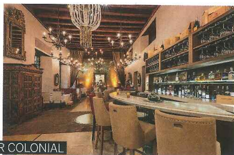
UN BAR COLONIAL

Nada más acceder a su hall en colores estucados y mobiliario de época, penetras en su pasado colonial.