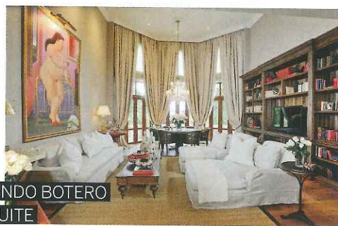
FERNANDO BOTERO Y SU SUITE

Disfruta de una completa carta de jugos y cócteles preparados con toda la variedad de frutas y especias.