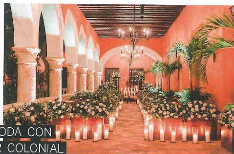
UNA BODA CON SABOR COLONIAL